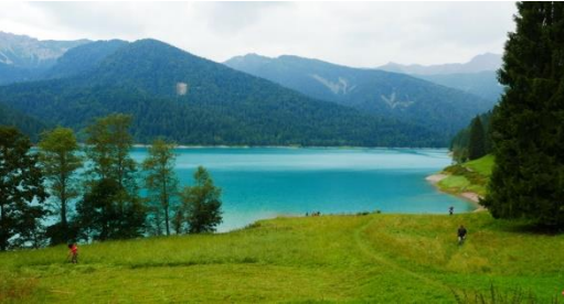
Einige Fotos und Eindrücke.....